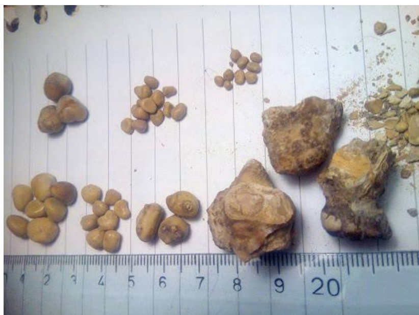
Заболявания на отделителната система